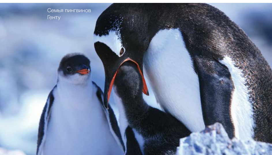
Семья пингвинов Генту