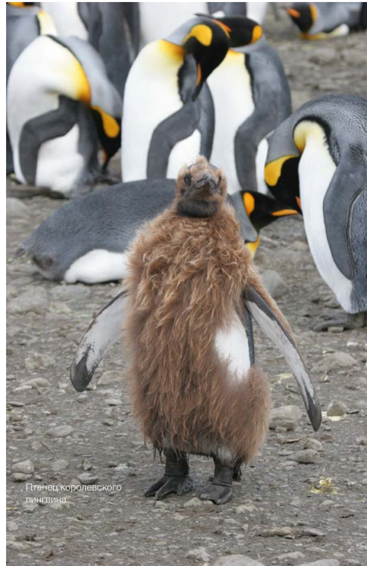
Птенец королевского пингвина

Благодаря грамотно составленной программе у меня за 18 дней в Антарктиде не воз-