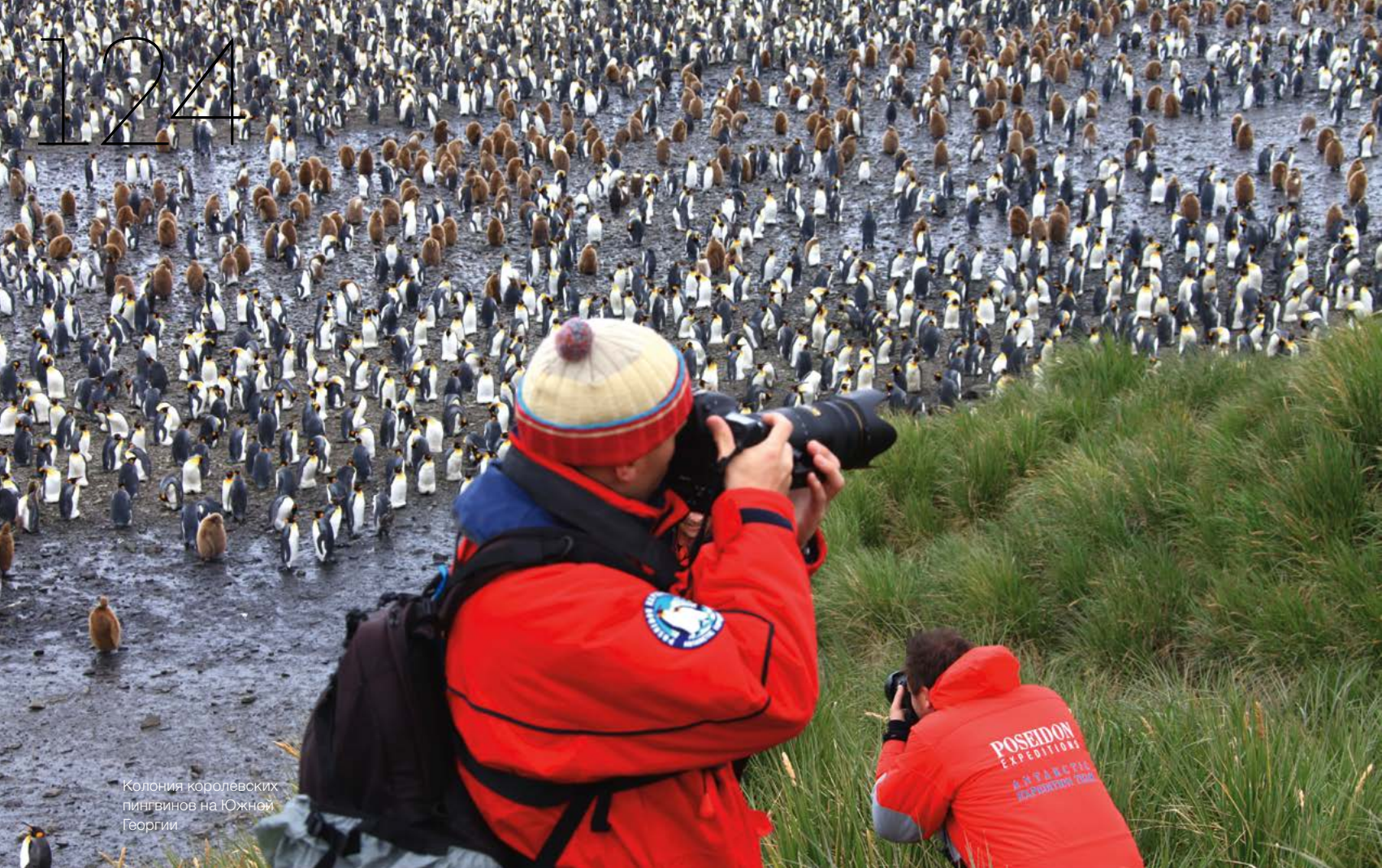
Колония королевских пингвинов на Южной Георгии.

лимим светом. Здесь поработал даже не архитектор, а, скорее, ювелир, создавший точечные грани волшебных фигур и игру света, которая и не снилась Swarovski. Вот ледяной кит, а тут пещера, которую море выгрызло в толще айсберга. А вот морской леопард – не ледяной, настоящий.