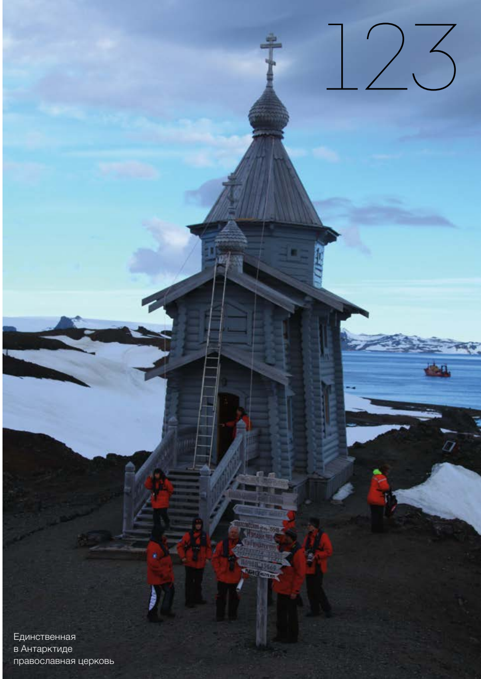
Единственная в Антарктиде православная церковь

отстают от своих родителей, поэтому и непонятно, что это детеныши. Неудивительно, что первые исследователи пингвинов ошибочно отнесли королевских пингвинят к отдельному виду – woolly penguin (пингвин, покрытый шерстью).