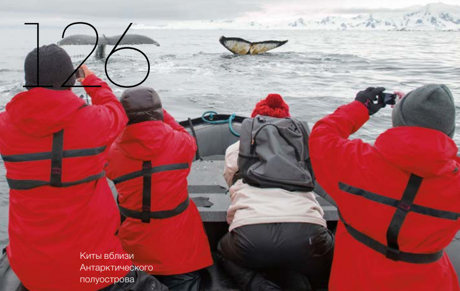
Киты вблизи Антарктического полуострова